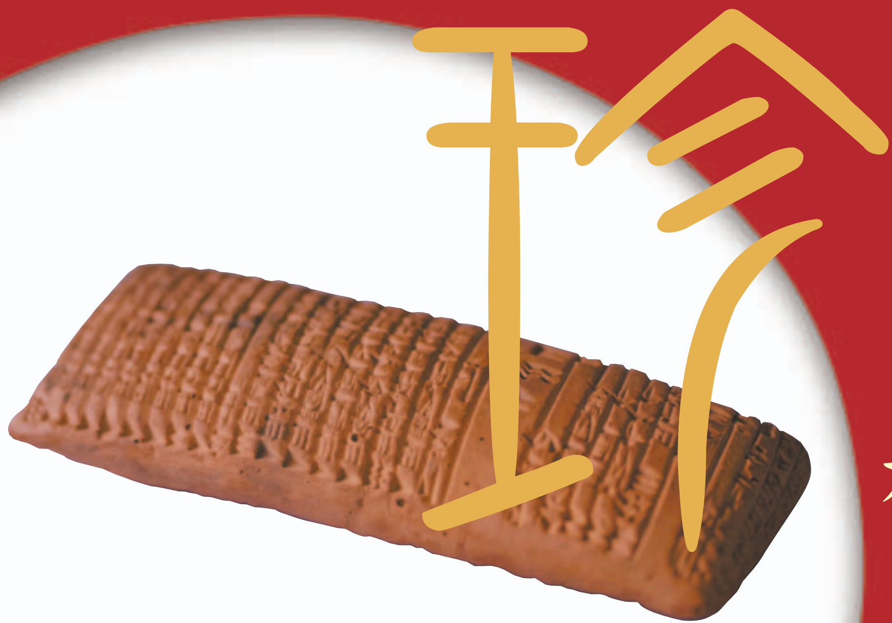
シュメール粘土板