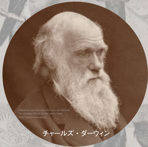
チャールズ・ダーウィン