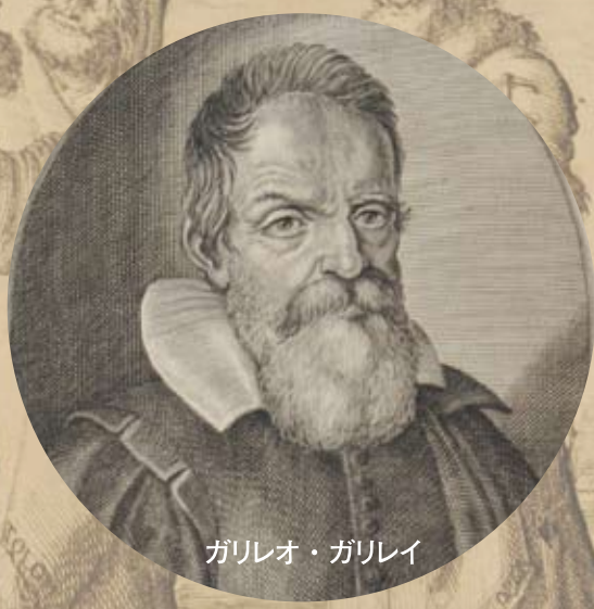
ガリレオ・ガリレイ