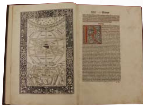
レギオモンタヌス 「アルmageスタ注釈」 1496年

そこで、今回の蔵書展は、天文学と生物学を中心に、後世に多大な影響を与えた15世紀半ばから19世紀にかけての貴重書を37点展示いたします。現代に至るまでの科学史の一端をぜひご覧ください。