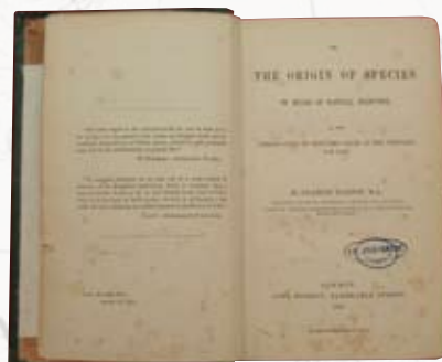
ダーウィン 「種の起源」 1859年