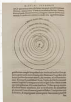
コペルニクス「天体の回転について」 1543年